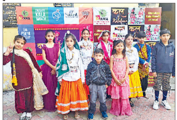
झज्जर। कल के कलाकार प्रतियोगिता के प्रतिभागी।

भूमिका निभाता है। नृत्य से बच्चों में एकाग्रता, रचनात्मक और आत्मविश्वास जैसे गुणों का विकास होता है। इस उपलब्धि पर चेयरमैन