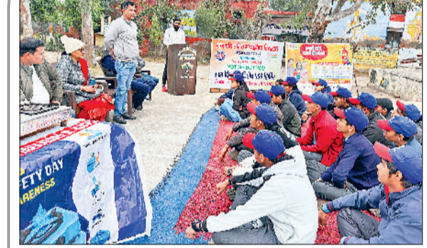
झज्जर। स्वयंसेवकों को घरेलू गैस का प्रयोग करने संबंधी जानकारी देते हुए वक्ता।