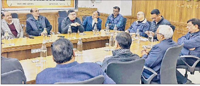
बहादुरगढ़। बैठक में औद्योगिक क्षेत्रों को नियमित करने पर चर्चा करते कोबी सदस्य।