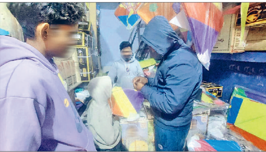
झज्जर। पतंग व डोर की खरीददारी करते युवक।

शहर के विभिन्न गली मोहल्लों व मेन बाजार में प्रतिबंधित चाइनीज मांझा अवैध रूप से बिक रहा है। इस तेज धारदार मांझे से न केवल आमजन को परेशानी हो रही है बल्कि पशुओं के लिए भी जानलेवा साबित हो रहा है। इसके अलावा सड़कों पर बिखरे इस मांझे के कारण वाहन चालक भी चोटिल हो रहे हैं। बीते वर्ष भी इस मांझे से कई लोग और पशु घायल हो चुके हैं। फिर भी ऐसे दुकानदारों के खिलाफ कोई सख्त कार्रवाई नहीं की जा रही है। इसके कारण आमजन में प्रशासन और संबंधित इकाई के प्रति रोष भी बना हुआ है। प्रशासन द्वारा प्रतिबंध लगाए जाने के बावजूद भी चाइनीज मांझा धड़ल्ले से बिक रहा है।