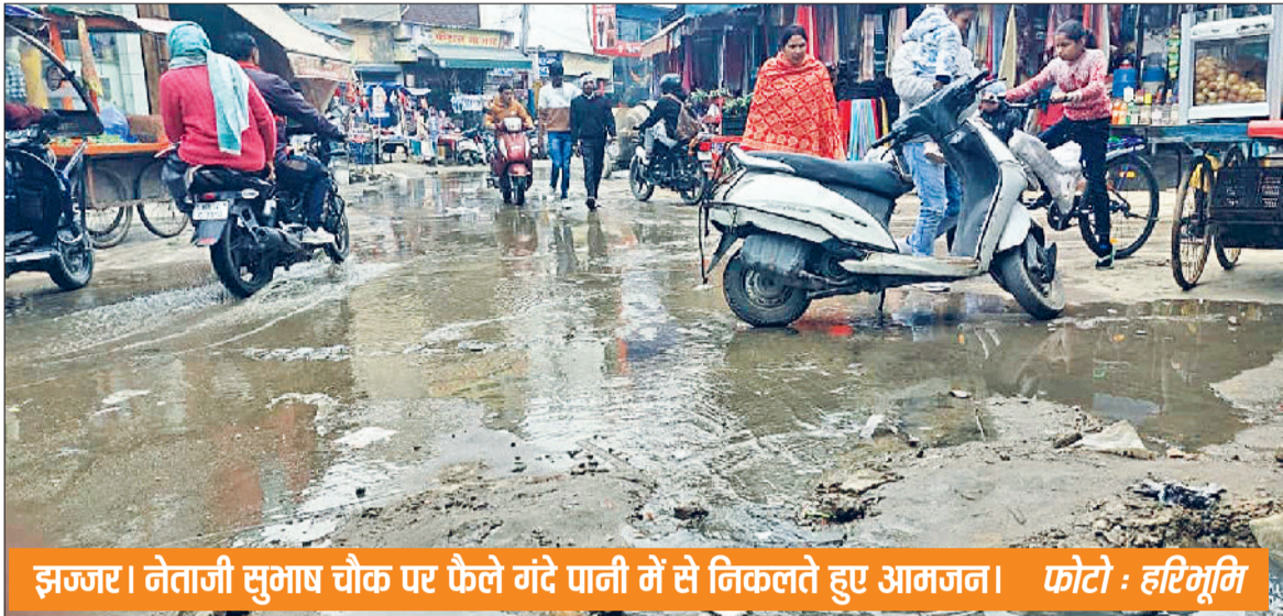
झज्जर। नेताजी सुभाष चौक पर फैले गंदे पानी में से निकलते हुए आमजन।