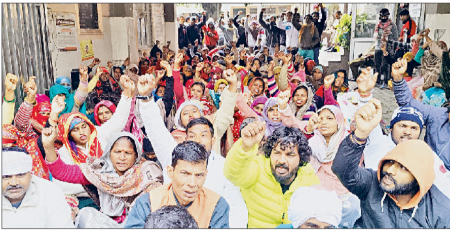
बहादुरगढ़। परिषद के गेट पर धरना देते सफाई कर्मचारी।

बकाया वेतन की मांग तथा ढेका प्रथा के विरोध में लगातार दूसरे दिन भी सफाई कर्मचारियों का प्रदर्शन जारी रहा। शुक्रवार को कर्मचारियों ने नगर परिषद के गेट पर धरना देकर जमकर नारेबाजी की और मांग पूरी होने तक विरोध जारी रखने का ऐलान किया। उधर, सफाई कर्मचारियों की हड़ताल के चलते बहादुरगढ़ शहर की सफाई व्यवस्था प्रभावित हो रही है और