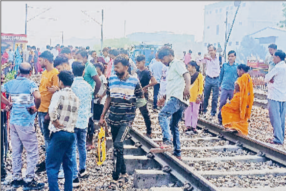
बहादुरगढ़। रेलवे ट्रैक पर हुए एक हादसे के बाद जमा लोग।

देखते लोगों ने जीआरपी व रेलवे से इस दिशा में आवश्यक कदम उठाने की मांग की है। वहीं जीआरपी की ओर से भी रेलवे को पत्र लिखा गया है। एक माह के अंदर ही दो हादसों में चार लोगों की जान जा चुकी है।