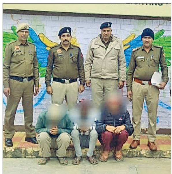
झज्जर। पकड़े गए आरोपी पुलिस टीम के साथ।

संदेह के आधार पर पकड़े गए व्यक्तियों की नियमानुसार तलाशी लेने पर उनके कब्जे से नशीला पदार्थ हेरोइन बरामद हुआ। जिसका वजन करने पर सात ग्राम पाया गया। पकड़े गए आरोपियों की पहचान